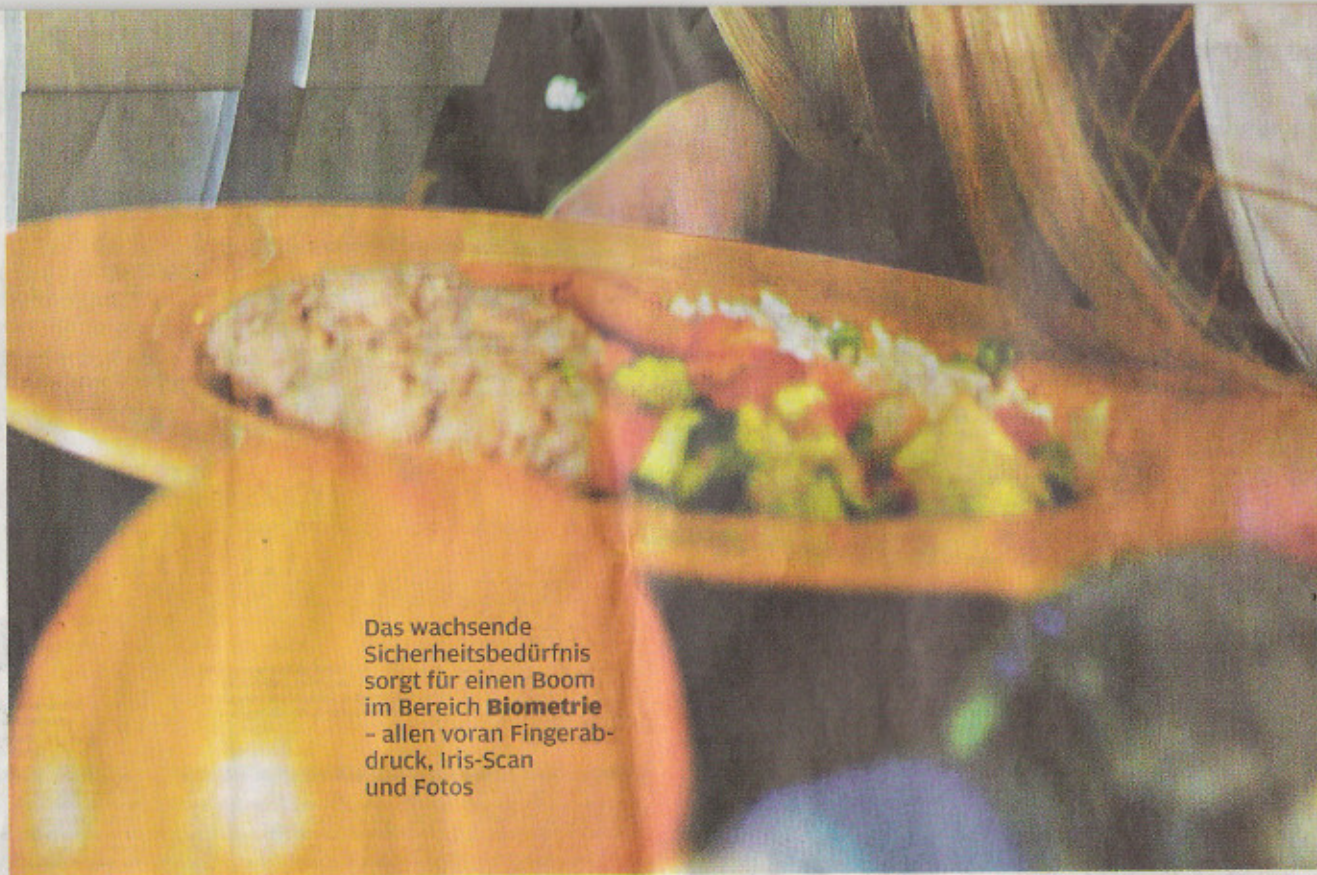
Das wachsende Sicherheitsbedürfnis sorgt für einen Boom im Bereich Biometrie – allen voran Fingerabdruck, Iris-Scan und Fotos

Nächstes Jahr soll auch das neue Computersystem für die Schengen-Zone SIS II einsatzbereit sein. Dieses soll biometrische Daten wie digitale Passfotos oder Fingerabdrücke speichern können.